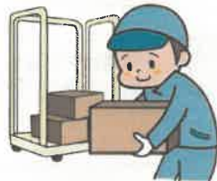
仕分け、ピッキング作業