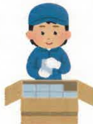
製造 ライン・検査作業