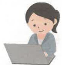
パソコン入力作業